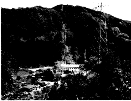
(熊本県を流れる「球磨川」支流にある発電所) 沿い、歩き続け

今回は熊本県側の一部をまわりました。深い山からの細い湧き水を可能な限り集め、川の一部から水を取り込み、それらを合わせて徐々に大きな流れにし、山を貫通する水路用のトンネルを通し、或いは、山越えの配管、暗渠等を経由し、発電所の上まで大事な水を運びます。これらの設備は古い