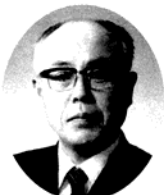
〔略歴〕 昭和十八年母校卒業後教職に、母校の校長外幾多の高校長を歴任後広島県立多高高等学校協会の会長外、要職に。文部大臣教育表彰・勳四等瑞宝章叙勲を受章。現在、庄原地区社会福祉協議会長等

郷土庄原は今、満目緑一色、野山は濃淡の緑が光に映え、水田は根づいた苗が一面緑の絨毯を敷きつめたよう、時折やわらい風に揺れて波紋を描く風景は心を癒やします。