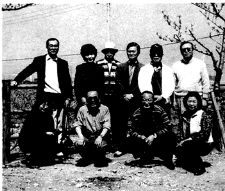
桃源郷で桃畑を背景に

(栄様は過年度に出資いただきましたながら会報掲載が漏れていたものです。慎んでお詫び申し上げます。)